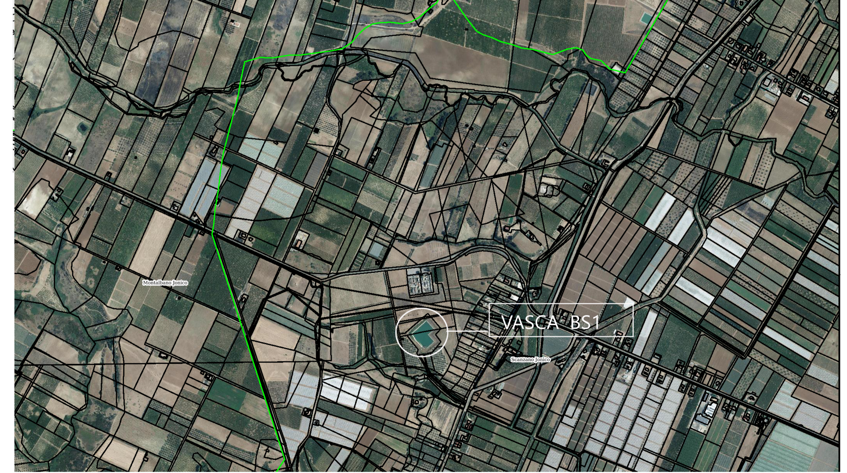
PLANIMETRIA CATASTALE - SOVRAPPOSIZIONE ORTOFOTO SCALA 1:10.000