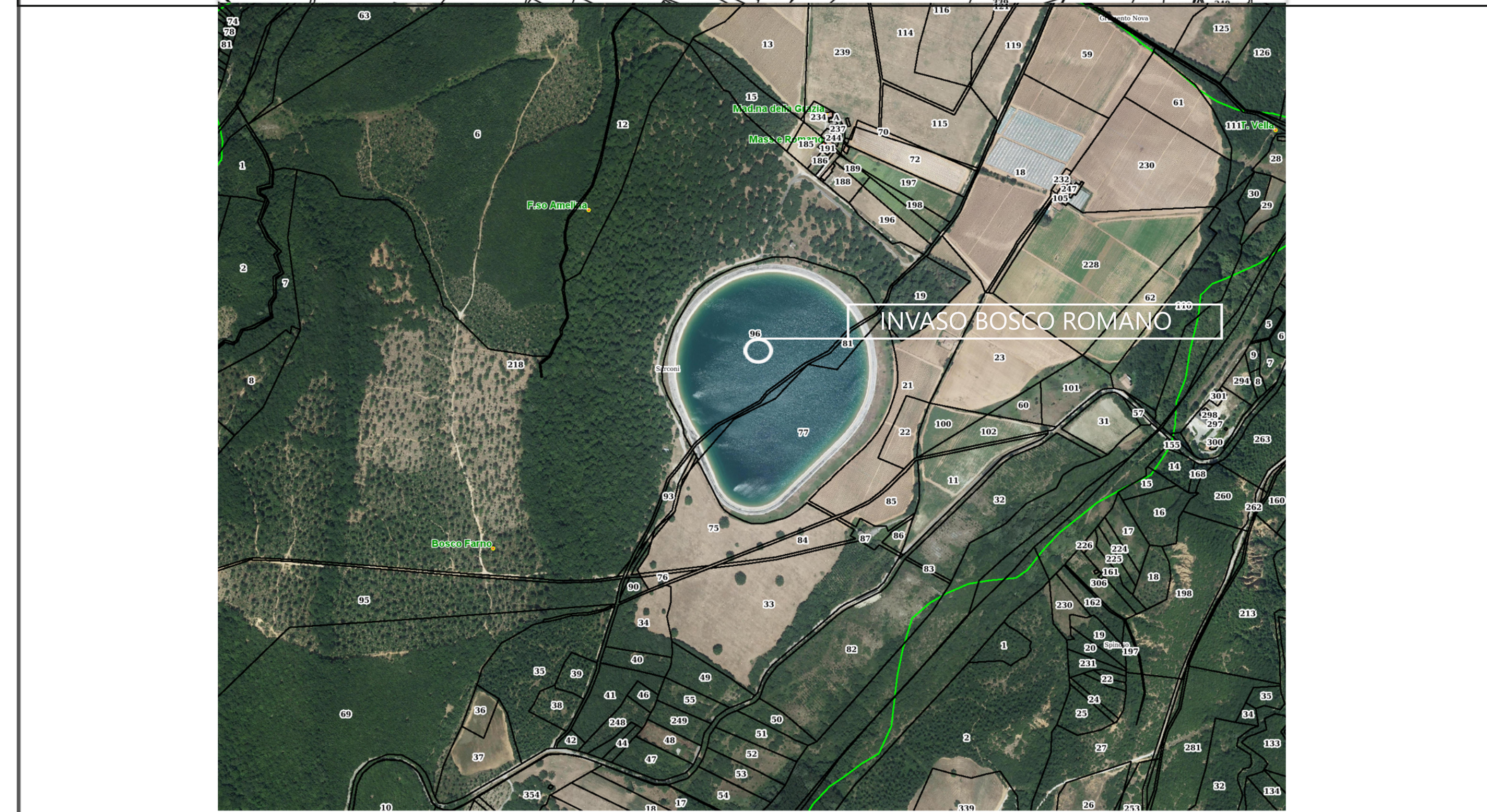
PLANIMETRIA CATASTALE - SOVRAPPOSIZIONE ORTOFOTO SCALA 1:10000