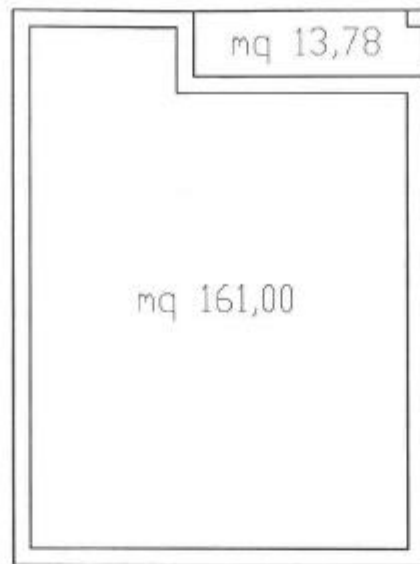
PIANTA LASTRICO SOLARE